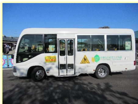
やまもと認定こども園