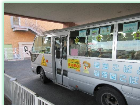
岩沼こばと・西こばと幼稚園