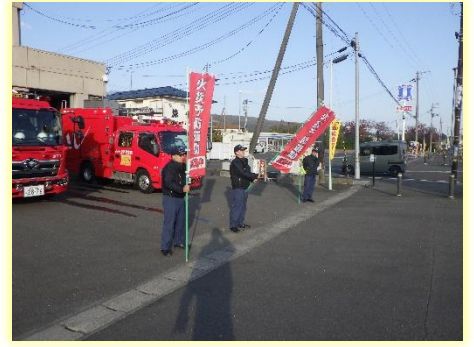
亘理消防署山元分署