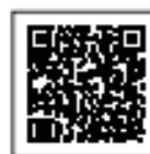
違反対象物公表制度