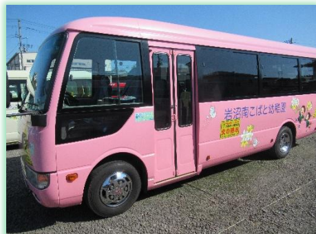
岩沼南こばと幼稚園