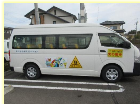
山元町つばめの杜保育所