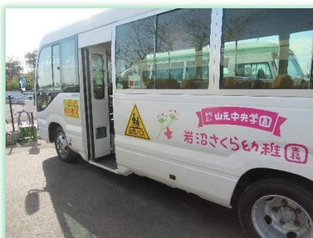
岩沼さくら幼稚園