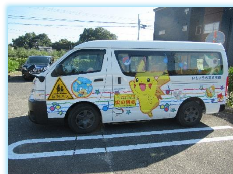
いちようの実幼稚園